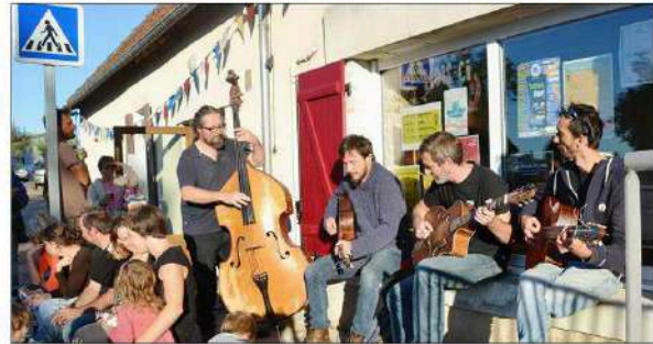
La Secousse est un lieu associatif ouvert sur les projets des habitants et des adolescents.