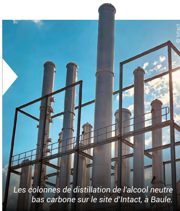
Les colonnes de distillation de l'alcool neutre bas carbone sur le site d'Intact, à Baule.