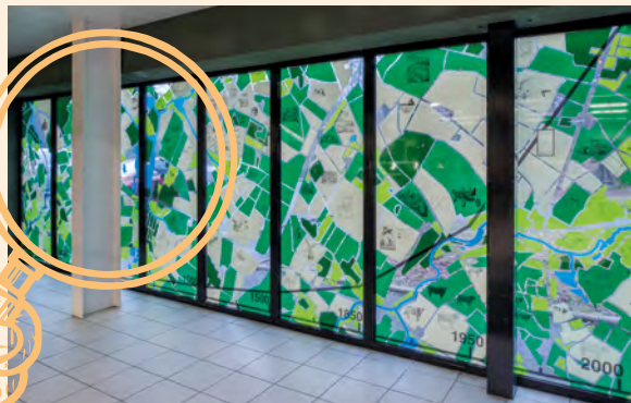
Le rapport à la salade, Julien Celdran. Vue d'ensemble depuis l'intérieur