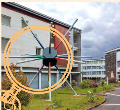
Le rayonnement, Philippe Vacher. Vue de situation © Région Centre-Val de Loire, Inventaire général, Thierry Cantalupo.