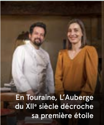
En Touraine, L'Auberge du XII e siècle décroche sa première étoile