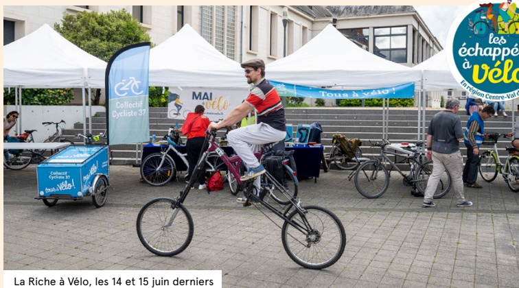
La Riche à Vélo, les 14 et 15 juin derniers

Depuis 12 ans, la Région Centre-Val de Loire accompagne les organisateurs d'escapades à bicyclette sur le territoire : il s'agit des Échappées à Vélo, soit près de 60 balades festives qui sont proposées entre mai et octobre afin de découvrir les richesses gastronomiques, patrimoniales ou naturelles de la région. Cet été, prenez le temps de flâner, de respirer et de goûter aux multiples saveurs, senteurs et paysages à proximité.