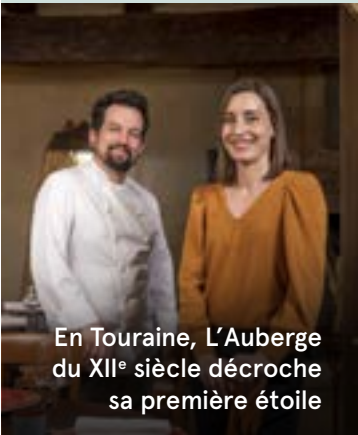
En Touraine, L'Auberge du XII e siècle décroche sa première étoile