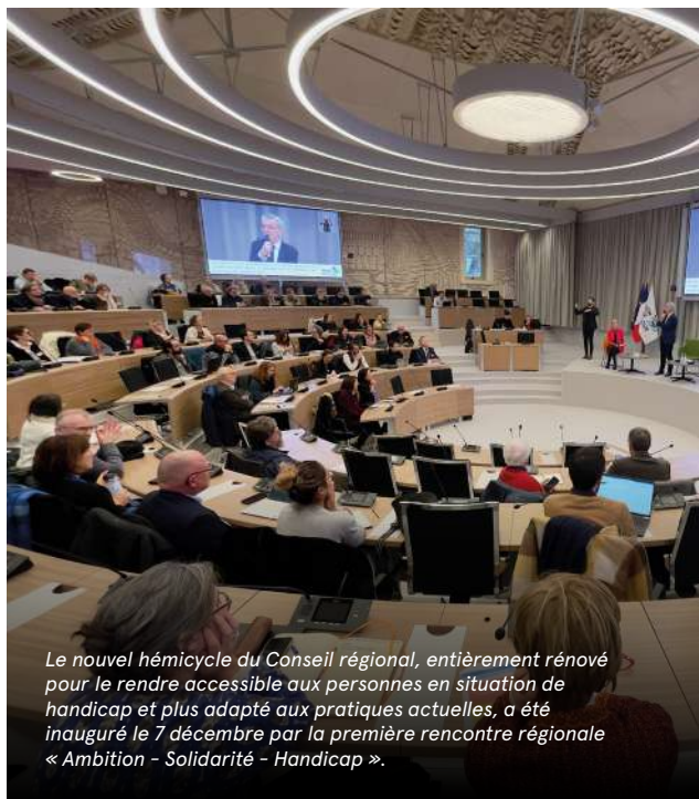
Le nouvel hémicycle du Conseil régional, entièrement rénové pour le rendre accessible aux personnes en situation de handicap et plus adapté aux pratiques actuelles, a été inauguré le 7 décembre par la première rencontre régionale « Ambition - Solidarité - Handicap ».

Lors des élections régionales de 2021, la liste « La Région au cœur » défendait la mise en place d'un réel bouclier de sécurité par le Conseil régional. En la matière, la majorité régionale frôle l'inaction, bloquée dans son alliance NUPES, alors que d'autres régions comme l'Occitanie sont déjà passées à l'action. Proposons enfin des moyens pour co-financer les équipements et les bâtiments des forces de sécurité, les équipements de vidéoprotection des communes, des entreprises ou des agriculteurs. Nous avons soutenu la création d'un centre d'urgence régionale contre les cyberattaques, proposition que nous avons formulé dans notre programme. En octobre, nous avons déposé un vœu pour la mise en place d'un plan de sécurisation de nos lycées et nos transports scolaires avec des moyens efficaces. Le travail est en cours avec l'Etat et nous serons très vigilants à la mise en place d'actions concrètes. Si les lycées ne doivent pas devenir des lieux d'enfermement, ils doivent être un lieu où les élèves, les enseignants et les agents se sentent en sécurité. Nous répéter que la sécurité n'est pas une compétence de la Région ne suffit pas, la sécurité de nos enfants dans les établissements scolaires et au-delà, de l'ensemble de la population, est l'affaire de toutes et tous : le Conseil régional doit se mobiliser !