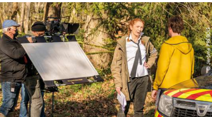
Tournage dans le Loir-et-Cher de Capitaine Marleau interprété par Corinne Masiero et diffusé sur France 3. Réalisation Josée Dayan.

Chaque année, de nombreux tournages de films ou séries se déroulent en Centre-Val de Loire. L'agence régionale Ciclic œuvre pour attirer les producteurs et assurer ainsi de nombreuses retombées pour le territoire.