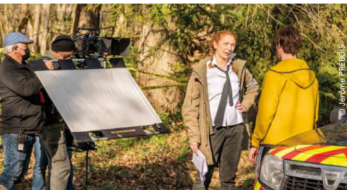
Tournage dans le Loir-et-Cher de Capitaine Marleau interprété par Corinne Masiero et diffusé sur France 3. Réalisation Josée Dayan.

Chaque année, de nombreux tournages de films ou séries se déroulent en Centre-Val de Loire. L'agence régionale Ciclic œuvre pour attirer les producteurs et assurer ainsi de nombreuses retombées pour le territoire.