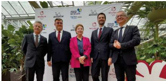
Le 18 septembre 2023, au Domaine de Chaumont-sur-Loire, Gwendall Poullennec, directeur international des Guides Michelin (à la droite de François Bonneau).

Le 18 mars prochain, la région Centre-Val de Loire accueillera à Tours la cérémonie du Guide Michelin France 2024. Plusieurs événements populaires autour de la gastronomie seront associés à ce rendez-vous.