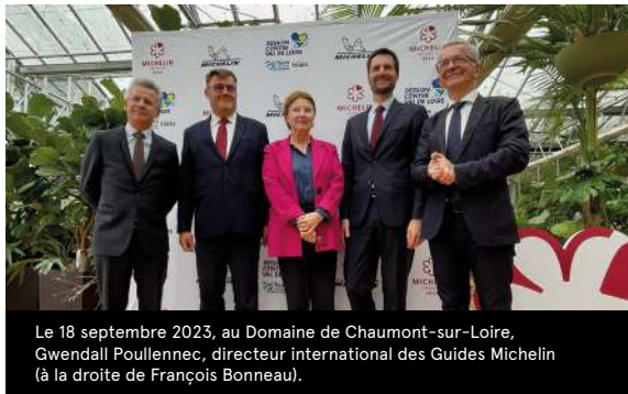
Le 18 septembre 2023, au Domaine de Chaumont-sur-Loire, Gwendall Poullennec, directeur international des Guides Michelin (à la droite de François Bonneau).

Le 18 mars prochain, la région Centre-Val de Loire accueillera à Tours la cérémonie du Guide Michelin France 2024. Plusieurs événements populaires autour de la gastronomie seront associés à ce rendez-vous.