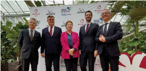
Le 18 septembre 2023, au Domaine de Chaumont-sur-Loire, Gwendall Poullennec, directeur international des Guides Michelin (à la droite de François Bonneau).

Le 18 mars prochain, la région Centre-Val de Loire accueillera à Tours la cérémonie du Guide Michelin France 2024. Plusieurs événements populaires autour de la gastronomie seront associés à ce rendez-vous.