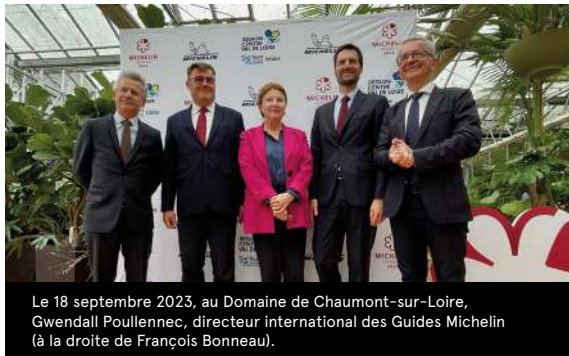
Le 18 septembre 2023, au Domaine de Chaumont-sur-Loire, Gwendall Poullennec, directeur international des Guides Michelin (à la droite de François Bonneau).

Le 18 mars prochain, la région Centre-Val de Loire accueillera à Tours la cérémonie du Guide Michelin France 2024. Plusieurs événements populaires autour de la gastronomie seront associés à ce rendez-vous.