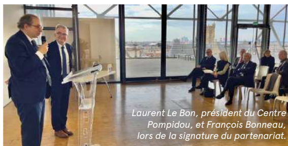
Laurent Le Bon, président du Centre Pompidou, et François Bonneau, lors de la signature du partenariat.

+ Ar(T)chipel, le festival révélateur d'une terre de création permanente, du 20 octobre au 5 novembre 2023, dans toute la région Centre-Val de Loire : Château de Talcy, Maison Dutilleul, CCCOD de Tours, Musée de l'Hospice d'Issoudun, L'arTsenal de Dreux...).