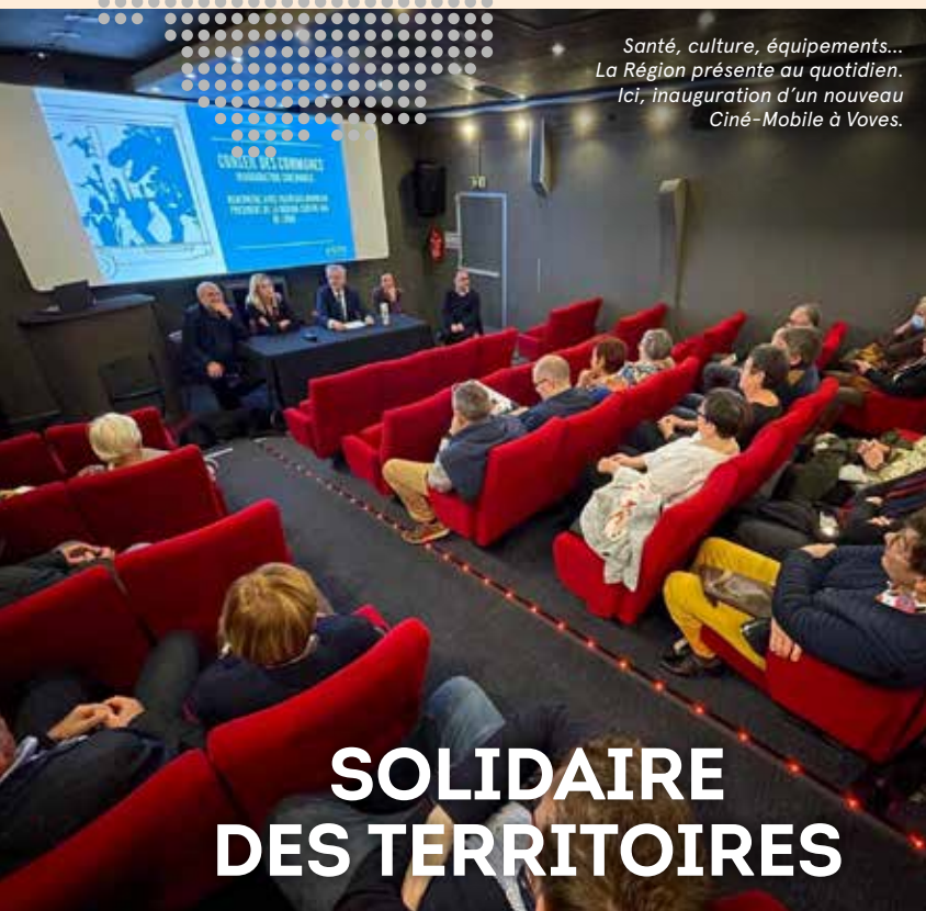
Santé, culture, équipements... La Région présente au quotidien. Ici, inauguration d'un nouveau Ciné-Mobile à Voves.