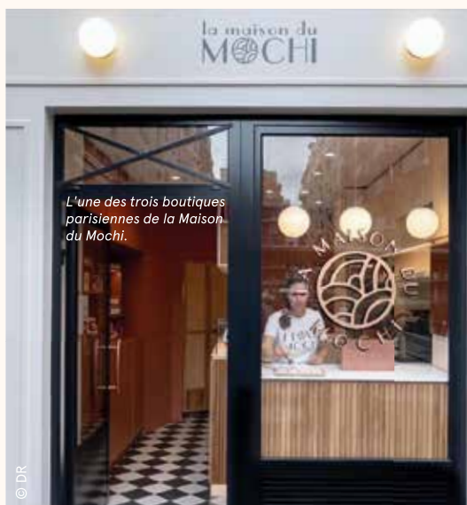
L'une des trois boutiques parisiennes de la Maison du Mochi.

Née à Saint-Martin-le-Beau, la Maison du Mochi poursuit son extension gourmande à Paris, et bientôt à Lyon.