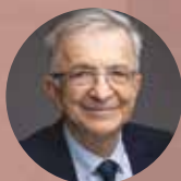
François Bonneau, président de la Région Centre-Val de Loire

« Pour mieux connaître les actions de la Région qui vous sont destinées, ce nouveau magazine, à paraître chaque trimestre, vous est personnellement adressé. »